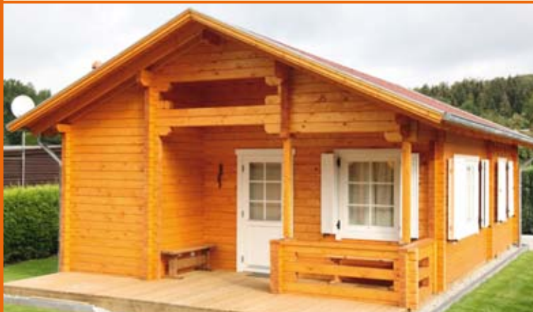
FERIENHAUS SPESSART 70/92 · Weitere Modelle und Größen erhältlich!