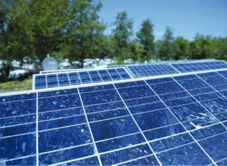
Zu einem klimafreundlichen Energiekonzept mit einem möglichst geringen CO 2 -Ausstoß gehört auch Solarenergie, deren Nutzung sich besonders auf Campingplätzen anbietet.

bei Schwerin als erster Campingplatz in Europa die Auszeichnung, vor kurzem folgte der Campingpark Kühlungsborn. Die Bedeutung geht aber bereits über die deutschen Grenzen hinaus: Auch der Jesolo International Club Camping in Italien erhielt die Auszeichnung (siehe Seite 22).