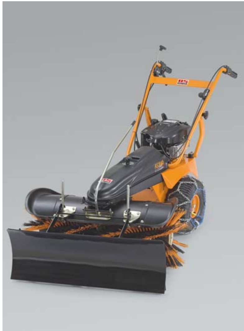
Schneeräumen ohne mühseliges Schippen: Der AS 1040 mit Schneeschild beseitigt auch verdichteten Schnee.