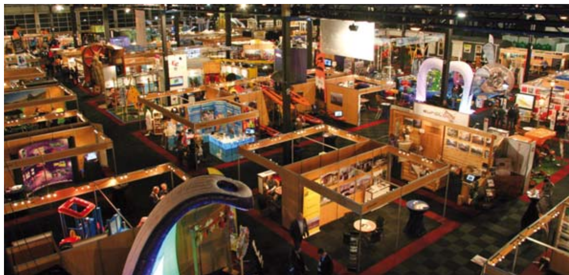
Im Südosten der Niederlande, im Grenzgebiet von Deutschland und Belgien, herrschen rege geschäftliche Aktivitäten. Da bietet die Messe Venray eine einzigartige Möglichkeit, neue Zielmärkte anzusprechen, und das zu einem interessanten Preis.

Information: Fachmesse Freizeit und Erholung Maarten Hernet Tel. (00 31) 5 32-28 98 34 maartenhernet@evententehal.nl www.evententehal.nl