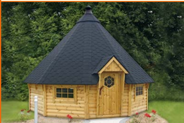
CAMPINGKOTA 17/25 m 2 · Weitere Modelle und Größen erhältlich!