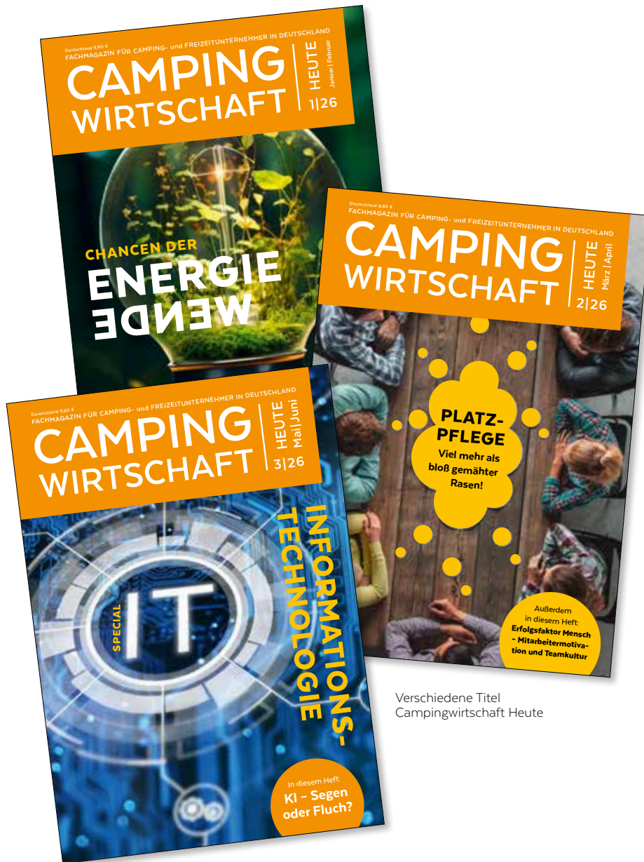
Verschiedene Titel Campingwirtschaft Heute

Alle branchenrelevanten Aspekte rund um Camping- und Freizeitwirtschaft